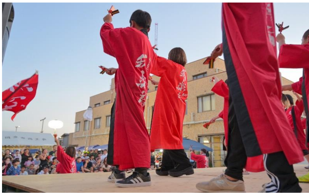
▲多くの方で賑わう、今年の会場