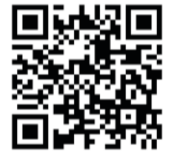
ええやん長岡京インスタ